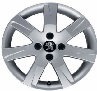
Jante alliage Santiaguito 2. 16"