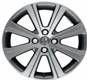
Jante alliage Melbourne 17"