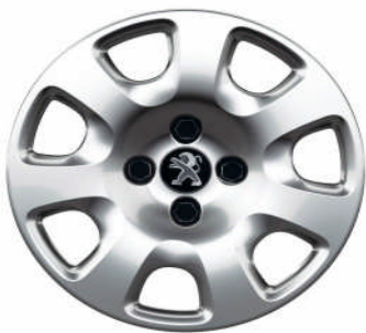
Enjoliveur Atacama 15"